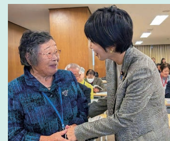
自民党鳥取県連中央研修会