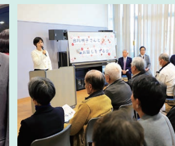
自民党松江支部女性局主催 「桃子さんとお話しをする会」