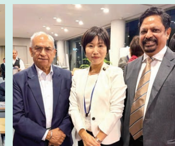
駐日インド大使館を訪問