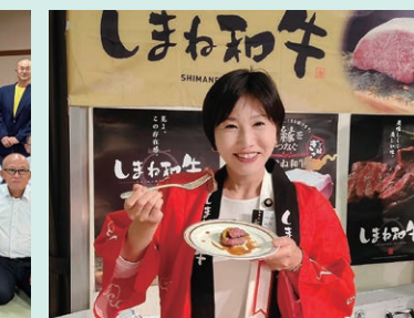
鳥取・島根和牛の魅力を全国へ