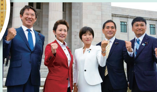
2025年8月1日初登院 国会議事堂前にて