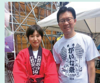
米子がいな祭りへ