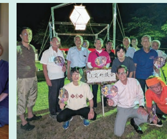
江府町江尾十七夜へ