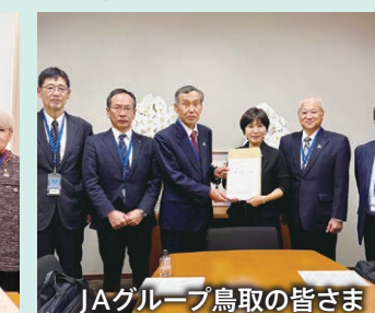
JAグループ鳥取の皆さま