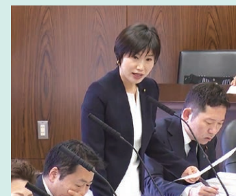
小野田大臣へ質問