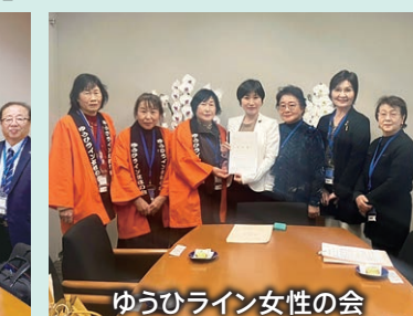
ゆうひライン女性の会

参議院会館の事務所では、県・市町村をはじめ、さまざまな団体の皆さまから直接ご要望を伺っています