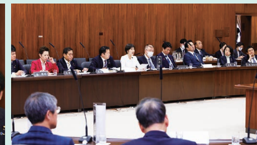
憲法審査会 合区問題の解決に向け発言