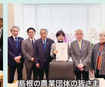
島根の農業団体の皆さま