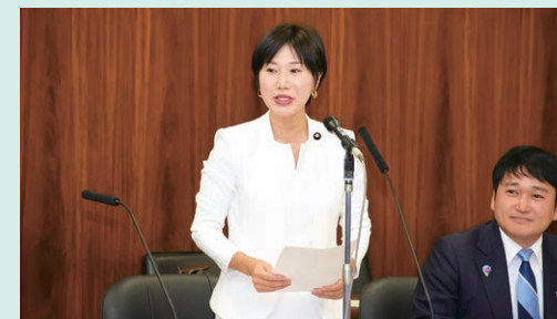
総務委員会 初質問