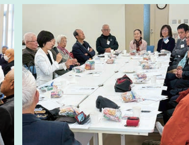
地域の皆さまと茶話会