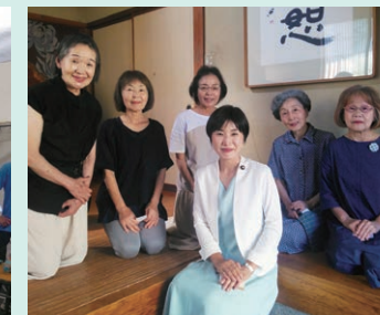
地域の皆さまとの温かい時間