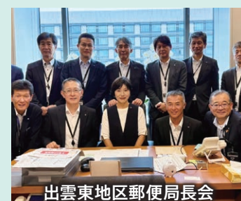
出雲東地区郵便局長会