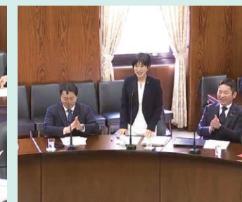
デジタル社会の形成 AI活用特別委員会