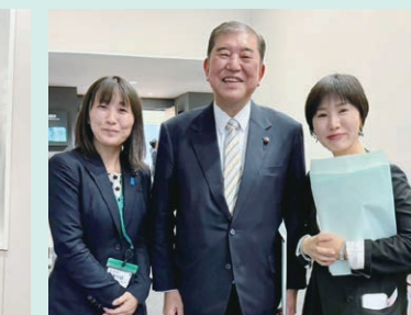
山陰近畿自動車道整備推進決起大会