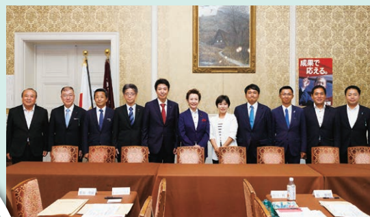
参議院議員当選同期十一名 士(さむらい会)の仲間とともに