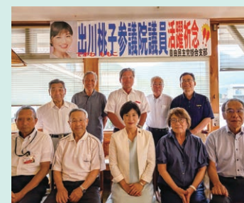
地域の皆さまと意見交換会