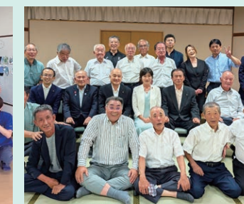
地域の皆さまへ国政報告